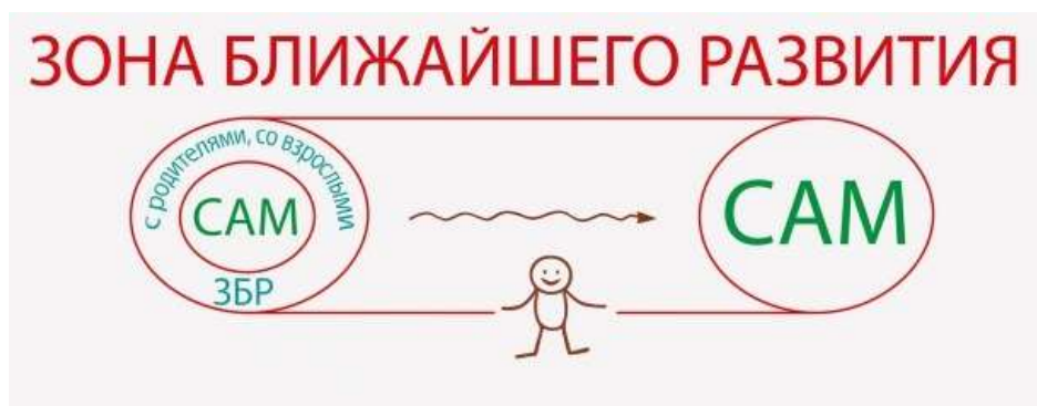
Рисунок 2. Что такое зона ближайшего развития ребенка

Зона ближайшего развития – это то, что ребенок пока не способен сделать самостоятельно, но может выполнить с помощью взрослых или старших детей (рисунок 2).