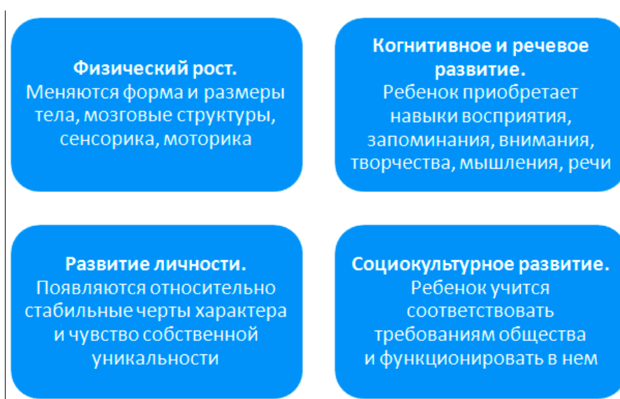
Рисунок 1. Направления развития ребенка

Изменения, которые происходят с ребенком, бывают двух типов: рост и развитие. Подробности на рисунке 1.